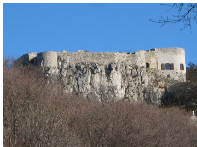
Grad Socerb / Castello di San Servolo