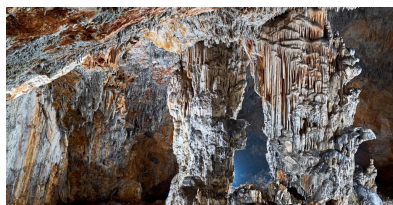
Dimnice / Grotta del Fumo