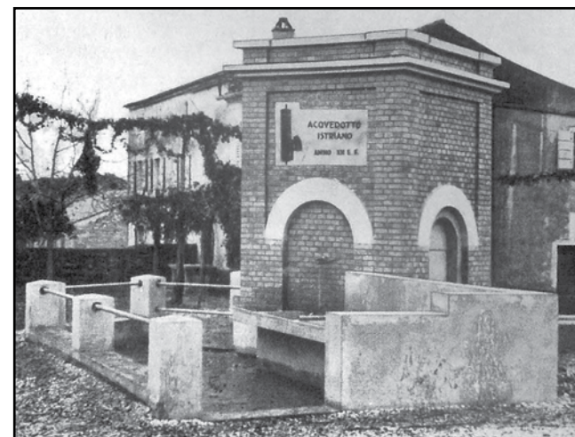
Fontana con abbeveratoio e lavatoio dell'Acquedotto Istriano / Fontana za pitje in pranje perila v sklopu Istrskega vodovoda (Risano / Rižana, maggio / maj 1935)

Rodil se je v Vidmu leta 1980. Je učitelj razrednega pouka na šoli Istituto Comprensivo v Pagnaccu v Videmski pokrajini in raziskovalec na področju zgodovine. Je avtor številnih objav o zgodovini Furlanije iz obdobja 20. stoletja.